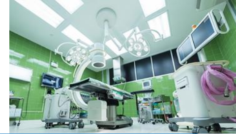
Medizintechnische und elektronische Anwendungen