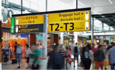
Analyse öffentlichen Orten mit erhöhtem Infektionsrisiko